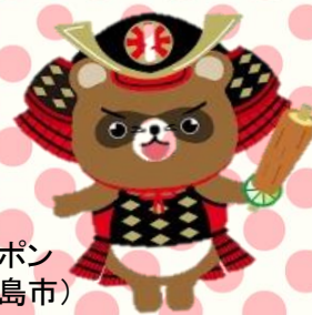
こまポン (小松島市)