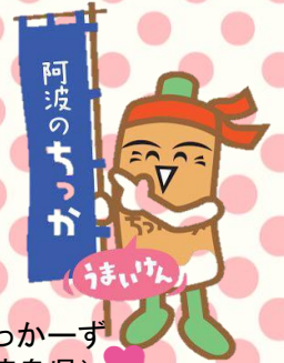
ちっかーず (徳島県)